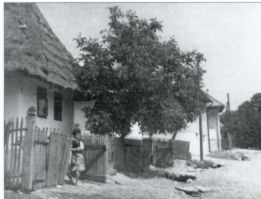
Rodný dom v Nižnej Kamenici

chal sa na neďalekom gejíze v Herľanoch. Po celý svoj život jediné miesto jeho pokojnej dovolenky bolo v rodičovskom dome, netúžil „objavovať nové miesta, more či iný svet“, tu si oddýchol najspokojnejšie. S rodičmi a sestrou žil v malom domčeku až kým neodišiel na stredoškolské štúdiá.