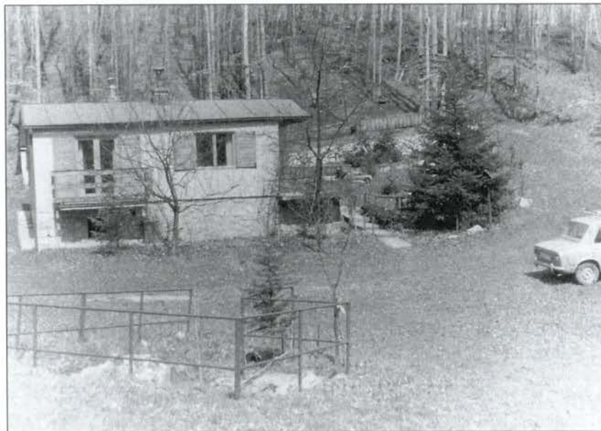
Chata v Limbachu (1971)

Vďaka nezištnej pomoci svojej manželky mohol sa pán profesor plne venovať svojej práci. Bola mu oporou nielen v zabezpečení plného chodu v domácnosti a výchovy detí, tiež v niektorých prácach jeho odbornej činnosti. Ako učiteľka prečítala a jazykovo opravila množstvo jeho textu, robila mu výpisky, zostavovala indexy do kníh. Túto mravenčiu činnosť nik nevidí, ale ako sa hovorí, za každým veľkým mužom je jeho matka a manželka. Jedna, čo dávala základy pre osobný rozvoj, vložiac mravné a sociálne zásady do života, druhá, čo udržiavala a rozvíjala ich talenty. Ich spoločný život charakterizuje „tvrdá námaha“ vo veľkomeste, pracovitosť „usilovných včiel“ a spoluprežitie nejednej skúšky. Začínali budovať svoj domov vlastnými rukami, umom v Bratislave. Neskôr si našli tiché miesto víkendového oddychu neďaleko Limbachu. Čo ich na spoločnej ceste postretlo, vedia len oni. Napriek rozdielnosti pováh a svojich záujmov vytvorili domov pre svojich synov a vnúčatá, vydržali spolu do konca života.