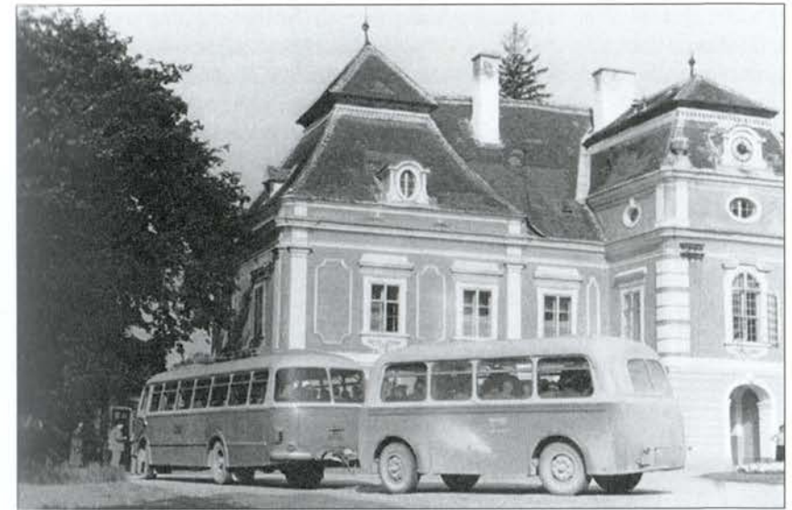
Budova kaštiela vo Veľkých Levároch s autobusom, ktorý vozil pacientov na výlety.

v policiach knižnice nemali ani náboženské knihy ani tie, ktoré by „ohrozovali pracovisko“.