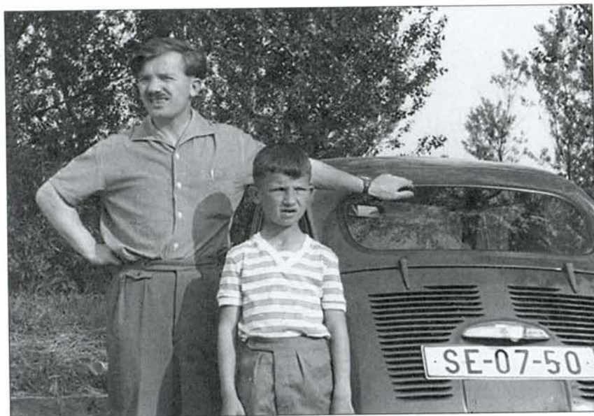
Prvé auto Fiat 600, ktoré ho sprevádzalo na životných cestách, prezrádza jeho skromnosť

Atmosféra Psychiatrickej liečebne vo Veľkých Levároch bola naplnená dobrými vzťahmi s kolegami ďalších psychiatrických liečební, nemocníc a zariadení, odkiaľ sa prichádzali pacienti doliečiť. Lekári s úctou prijali nového kolegu, s ktorým športovali popri odbornej spolupráci na oddelení.