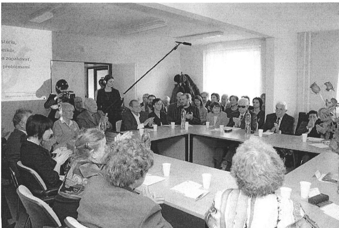
Pohľad medzi účastníkmi...