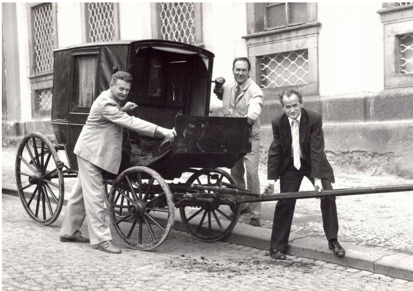
Na fotce: tři Jiri