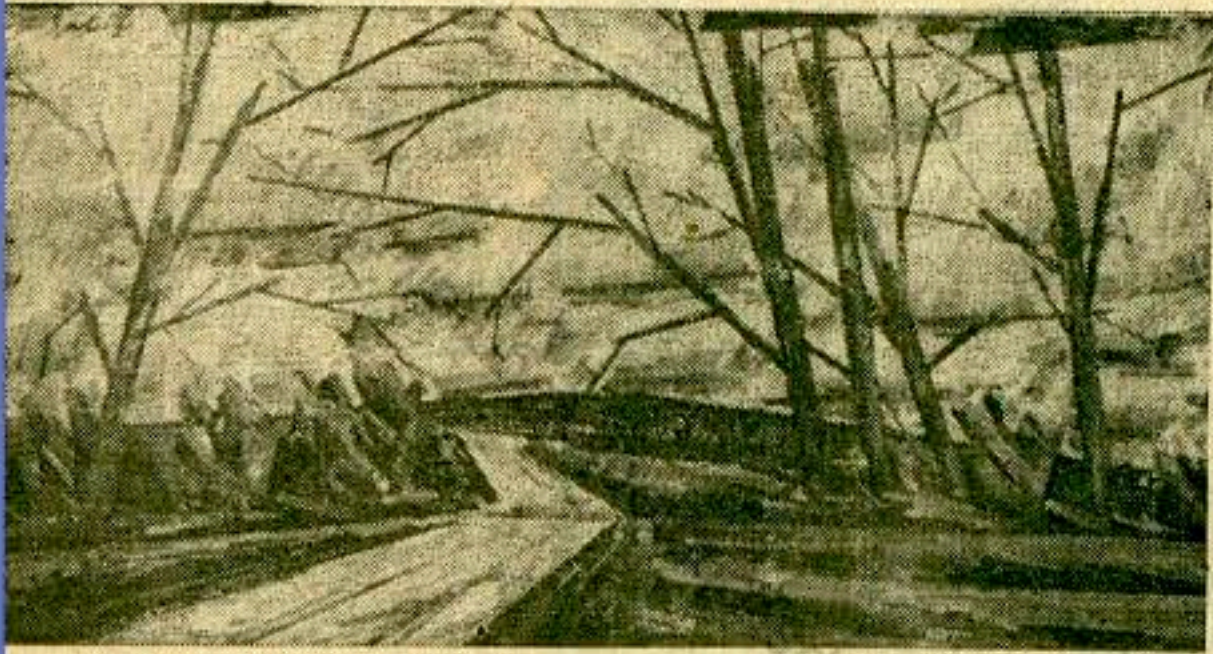
ALEXANDER SZABO: JESEN, olej 1961