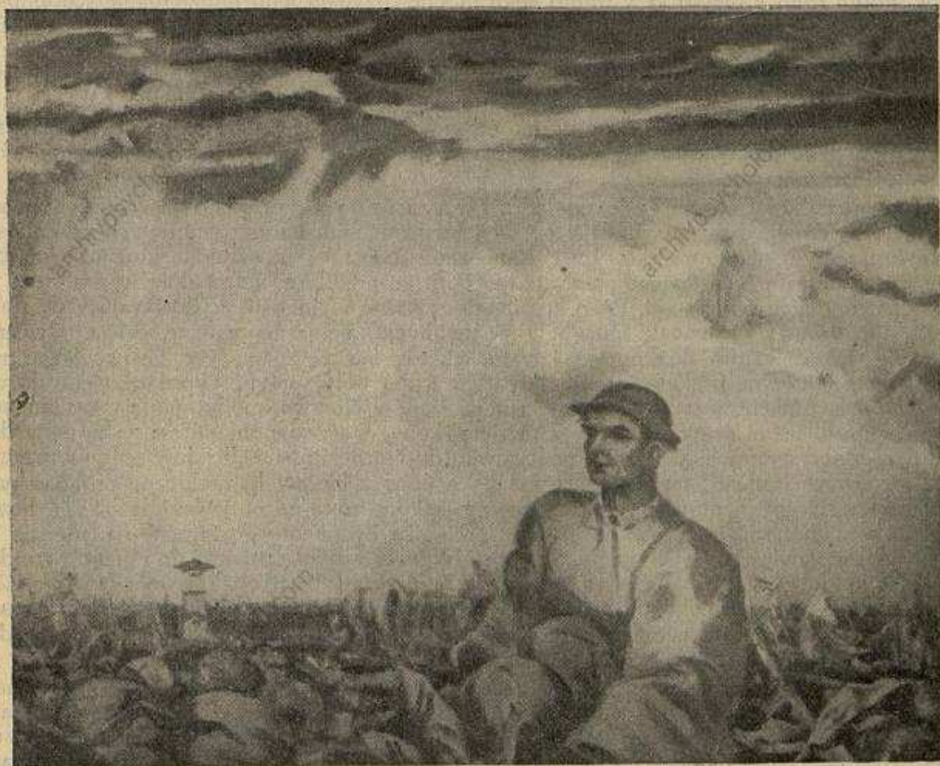
MARTIN BENKA: SBERANIE ÚRODY.

tuálne, rozumové funkcie, čiže schopnosti, ktoré v tomto období zaznamenávajú prenikavý a pritom vytrvanlivý vzrast. Vnímacie schopnosti, ktorými prijíma do seba svet vonkajší, dozrievajú v tomto veku na stupeň, na akom sú u dospelých. Dieťa vidí, počuje, čuchá, hmatá a tak ďalej, práve tak ako dospelý. Chýbajú mu pritom len prvky skúsenosti, ktoré pri vnímaní dospelého veľmi zavážia. Ale aj tieto si dieťa veľmi rapídne nadobúda. Mimoriadny vzrast zaznamenávajú aj funkcie predstavovacie. Rastie bohatstvo predstáv aj ich kombinácií, a teda v pravom slova smysle obrazivosť, fantázia. Schopnosť zapamätať si a naučiť sa tiež rastie. Dieťa sa ľahko učí, ľahko si vštepuje do pamäti to, čo zažíva, a ľahko si to vybavuje, teda ľahko sa na to rozepamätá a rozpomína sa na to. (Koľko ráz berieme dieťa so sebou niekde a rozkážeme mu, aby nám nedalo na to a to zabudnúť!)