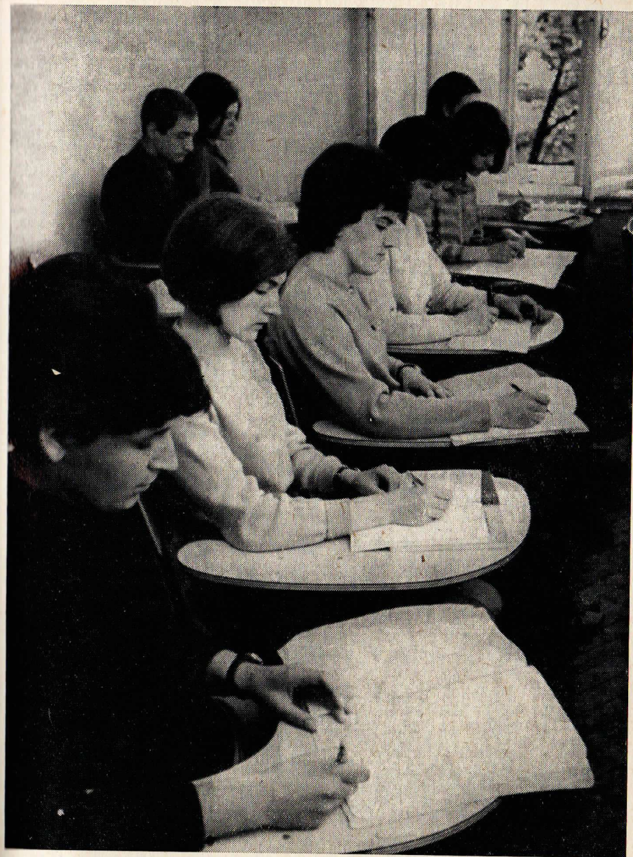
Poslucháči v špeciálnej učebni

Letný semester študijného roku 1967/68 sa začne 26. februára 1968 a končí sa 30. septembra 1968.