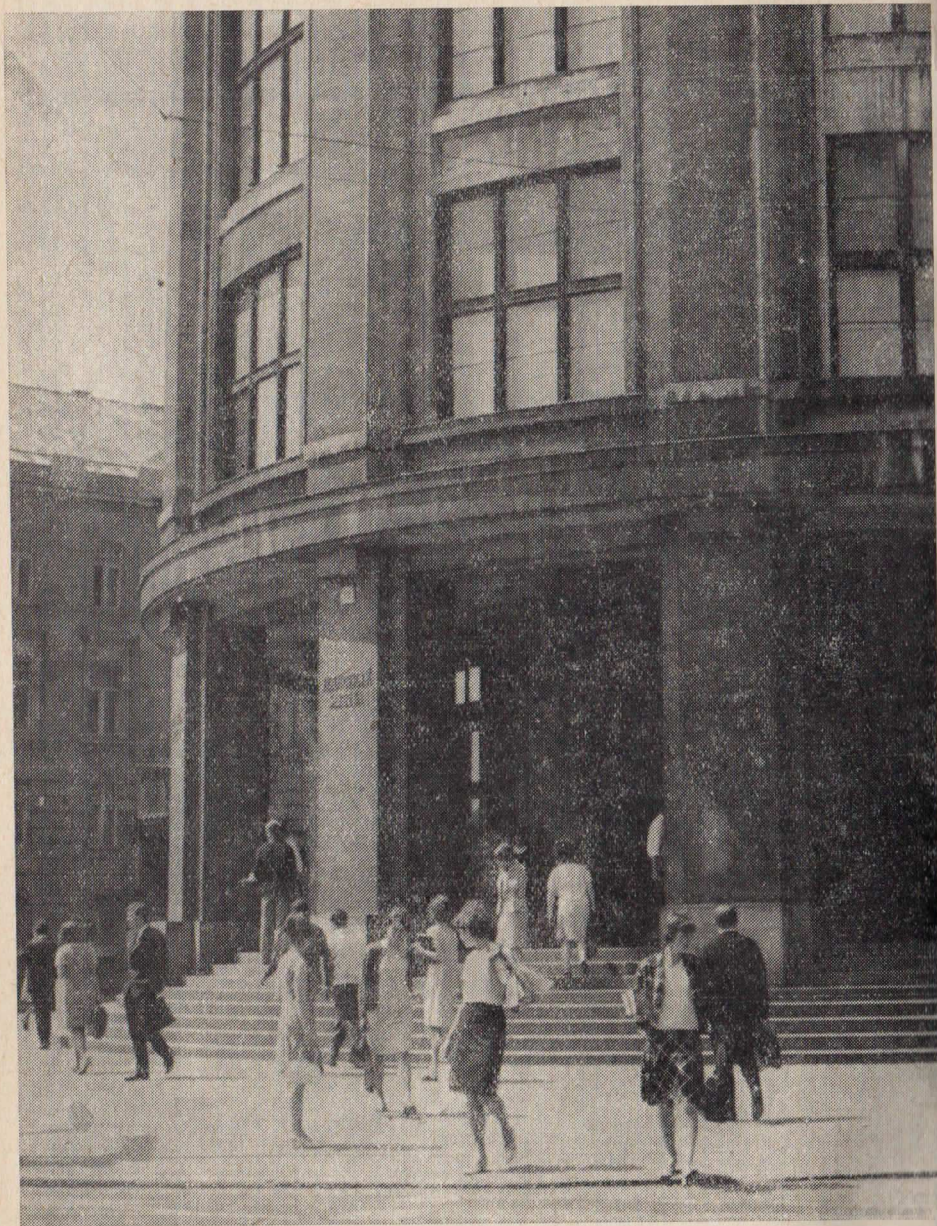
Budova Univerzity Komenského na Šafárikovom nám. 12