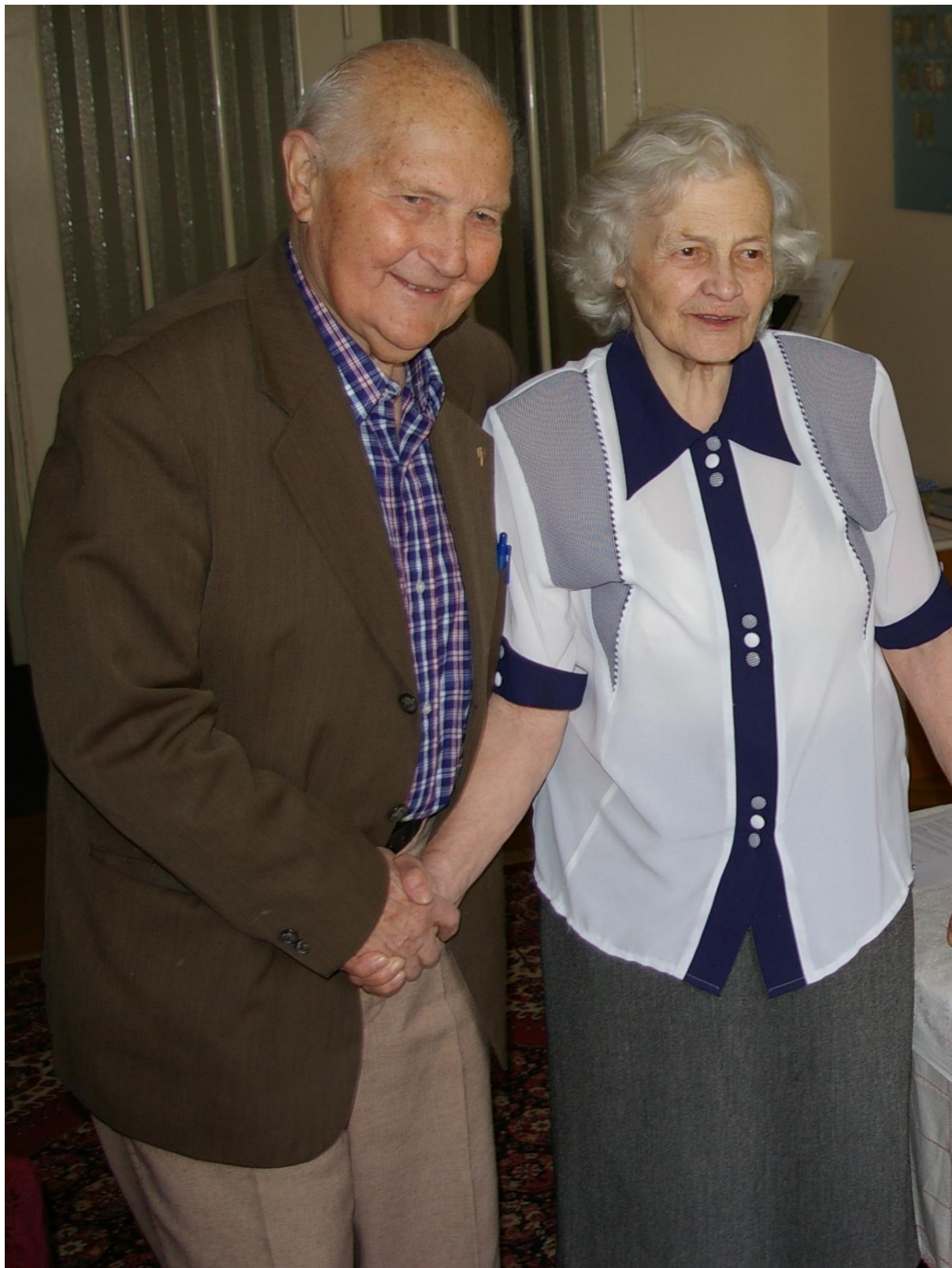
Svatopluka Čecha 407, Třebenice 411 13