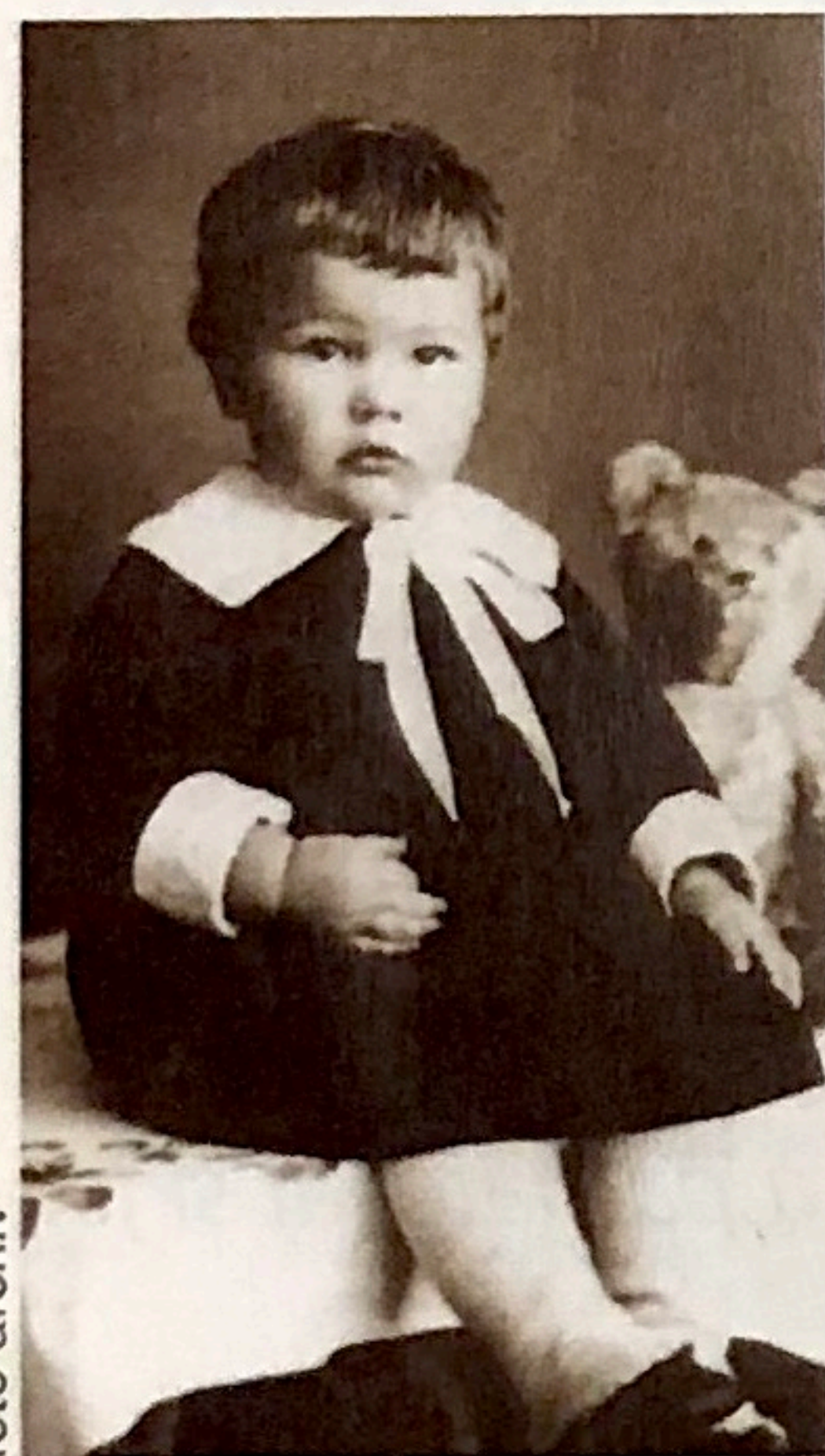
Zdeněk Matějček v jednom roce

Jak vzpomínají na jednoho z nejvýznamnějších českých psychologů profesora Zdeňka Matějčka, jeho blízcí spolupracovníci, přátelé a žáci?