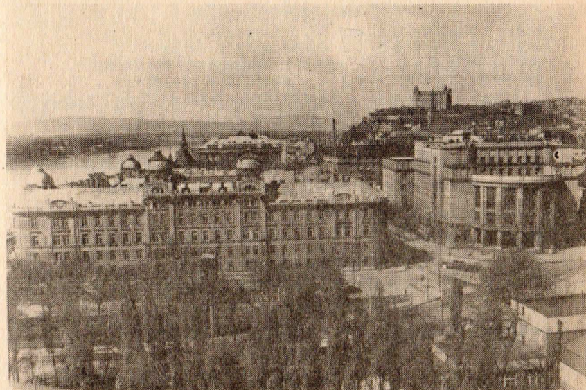
Filozofická fakulta UK v Bratislave