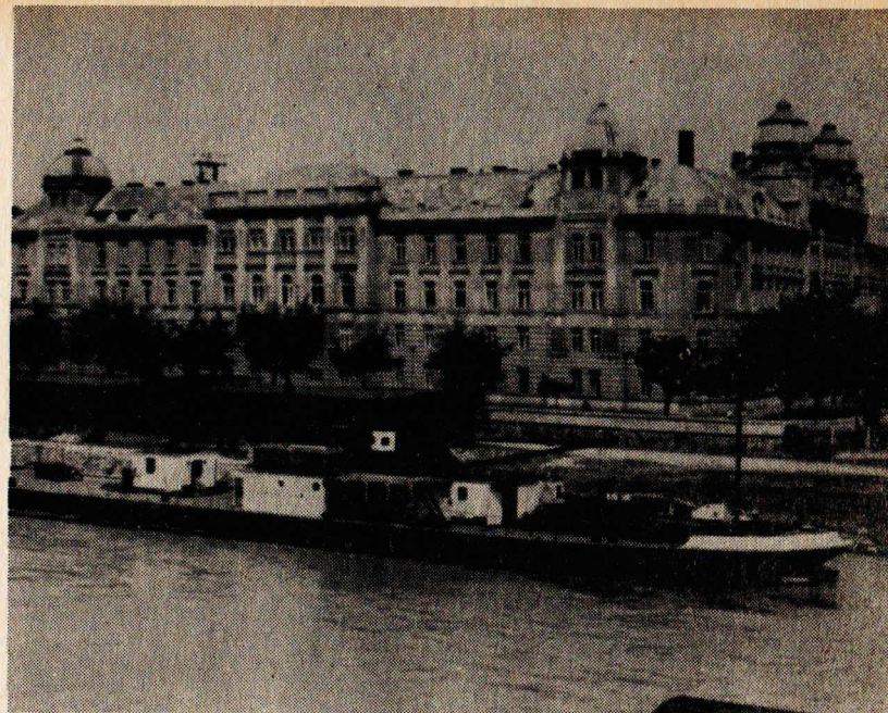
Filozofická fakulta Univerzity Komenského